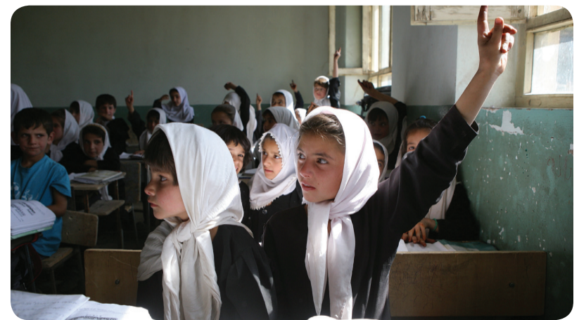
Aide à l'enfance Canada