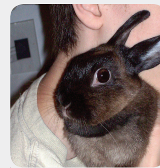
Fédération des sociétés canadiennes d'assistance aux animaux

D'autres ressources sont consultables en ligne, dont une foire aux questions et un modèle de présentation du Code d'éthique aux conseils d'administration ou aux cadres supérieurs. Consultez ces ressources dans le site Web du Code d'éthique ( http://www.imaginecanada.ca/fr/codedethique ), ainsi que la dernière liste en date des participants au programme.